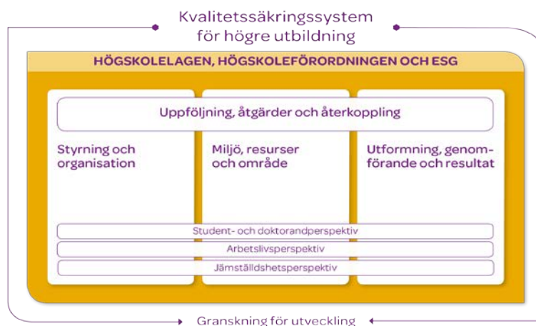
Fig 1. Modellen över UKÄ:s kvalitetssäkringssystem.

Inom varje aspektområde och perspektiv har UKÄ i dialog med företrädare för lärosätena, lärare, studenter, doktorander och arbetslivet tagit fram kvalitetsaspekter och bedömningsgrunder. Granskningarna baseras på kollegial bedömning av en oberoende extern bedömargrupp som vanligtvis består av sakkunniga, student- eller doktorandrepresentanter och företrädare för arbetslivet, som alla har samma formella status.