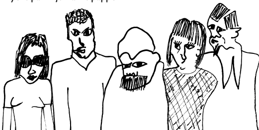
Illustration: Alexander Florencio