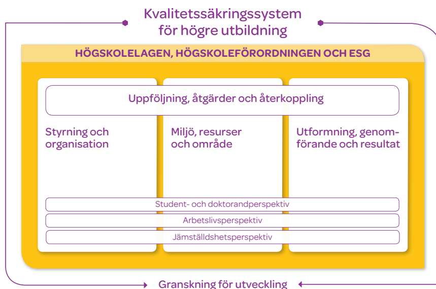
Figur 1. Översiktlig illustration över modellens aspektområden och perspektiv. Modellen vilar på högskolelagen, högskoleförordningen och ESG. Aspekter och perspektiv bedöms utifrån bedömningsgrunder. Aspektområdet "uppföljning, åtgärder och återkoppling" påverkas av och återverkar på de övriga aspekterna, och är därför inkluderat i bedömningsgrunderna för övriga aspekter. Lärosätena ombeds att beskriva, analysera och värdera med konkreta exempel hur de på ett systematiskt sätt säkerställer och följer upp att de uppfyller bedömningsgrunderna för de olika aspekterna och perspektiven.

För fullständig information om det nationella systemet för kvalitetssäkring av högre utbildning, se rapporten Nationellt system för kvalitetssäkring av högre utbildning – redovisning av ett regeringsuppdrag (Rapport 2016:15)